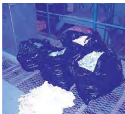
写真は不適物(長尺物)の例で、黒い袋に入れられていました。