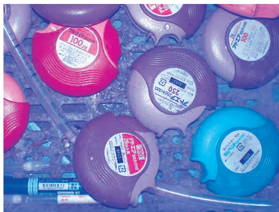
注射器・吸入器など