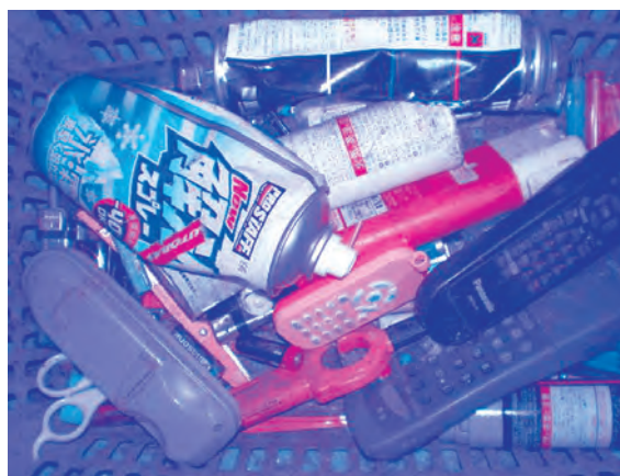
ライター、スプレー缶、カミソリ、乾電池、ハサミ