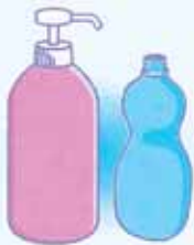
シャンプー洗剤のボトル