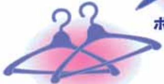
プラスチック製 クリーニングハンガー