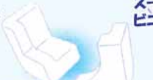
緩衝材(発泡スチロール)