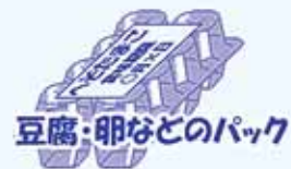
豆腐・卵などのパック