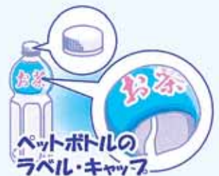
ペットボトルのラベル・キャップ