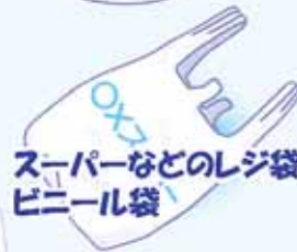
スーパーなどのレジ袋 ビニール袋