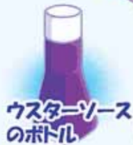
ウスターソースのボトル