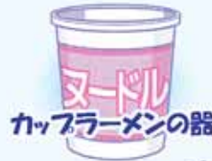
カップラーメンの器