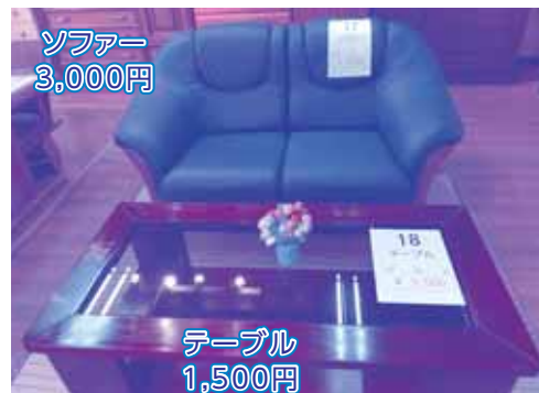
ソファー 3,000円 テーブル 1,500円

抽選日 7月4日(水)午後1時～ みどり園リサイクルプラザにて 応募締切日 7月3日(火)午後4時まで