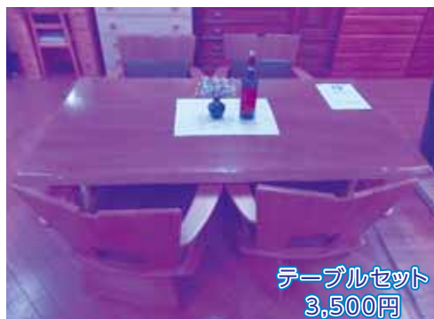
テーブルセット 3,500円