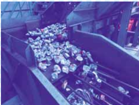
④ふるいの上には大きなもの、下には小さなものと大小を選別します。