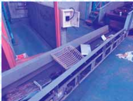
⑤選別された大小それぞれを次の処理ラインに送ります。