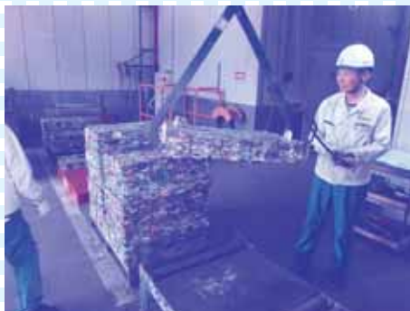
⑧プレス機により、アルミプレス品、スチールプレス品、破碎プレス品をそれぞれ成型します。