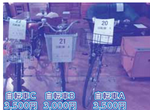
自転車C 3,500円 自転車B 3,000円 自転車A 3,500円