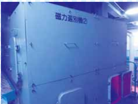
⑦この磁力選別機にて、スチールとアルミ等を選別します。