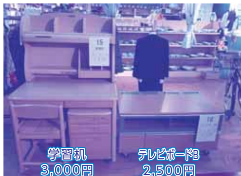
学習机 3,000円 テレビボードB 2,500円

抽選日 7月4日(水)午後1時～ みどり園リサイクルプラザにて 応募締切日 7月3日(火)午後4時まで