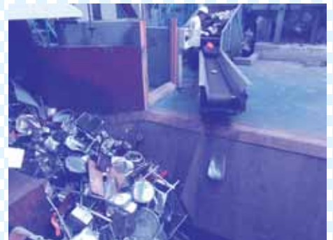
⑥大きなものは、この後、破碎機で小さくします。