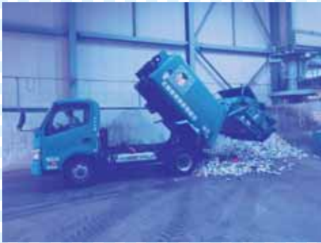
①ステーションで回収された金属類は、みどり園の中にあるプラットホームに降ろされます。