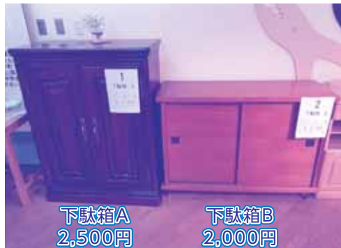
下駄箱A 2,500円 下駄箱B 2,000円

7月4日(水)に抽選予定のリサイクル家具です。商品は、現在リサイクルプラザ内で展示していますので一度見に来てみませんか?申し込みもできますよ。