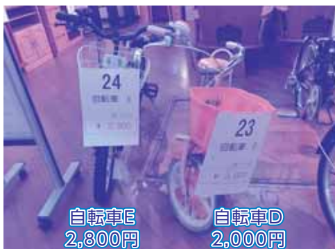
自転車E 2,800円 自転車D 2,000円