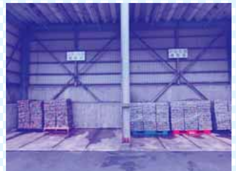
⑨プレス品の保管場所。左がスチールプレス品で、約70kg。右がアルミプレス品で、約25kg。