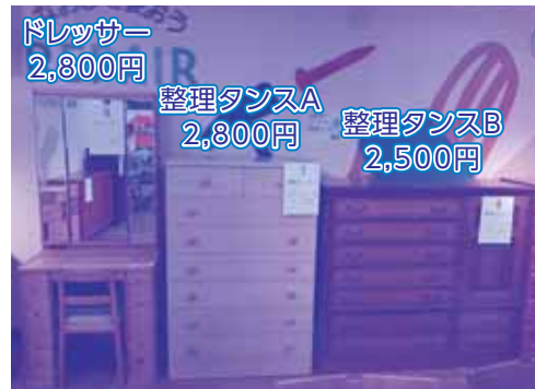
ドレッサー 2,800円 整理タンスA 2,800円 整理タンスB 2,500円