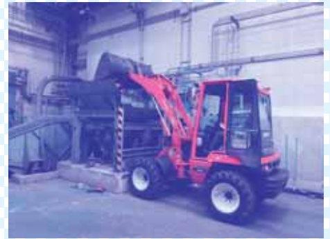
③その後、ホイールローダーで形状選別機に投入します。