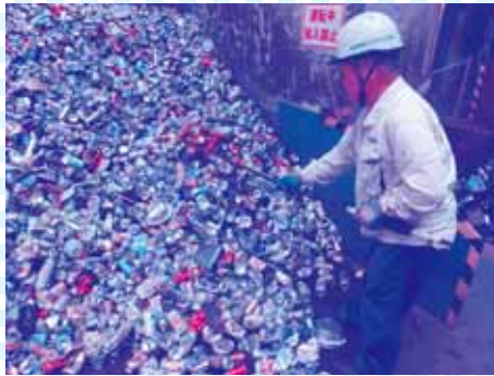
②受け入れた金属類から刃物や針金等処理不適合物を手選別除去します。