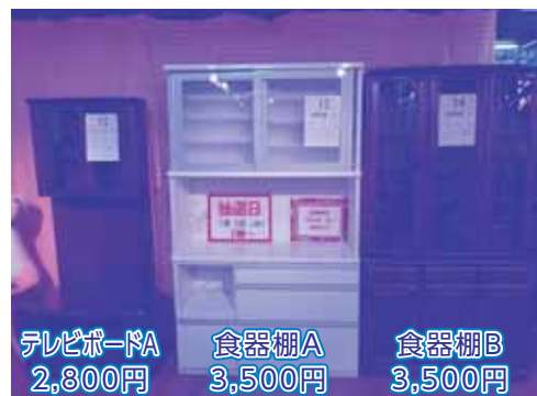
テレビボードA 2,800円 食器棚A 3,500円 食器棚B 3,500円