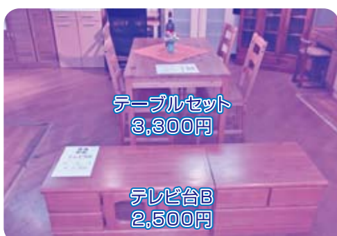
テーブルセット 3,300円 テレビ台B 2,500円

家の中に眠っている雑貨やいらなくなった古着は ありませんか? リサイクルプラザにお持ちいただければ、 リサイクルさせていただきます。 ※古着は、洗濯されているものに限りです。