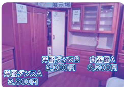
洋服ダンスB 2,000円 洋服ダンスA 2,800円 食器棚A 3,500円

抽選日 3月6日(水)午後1時~ みどり園リサイクルプラザにて 応募締切日 3月5日(火)午後4時まで