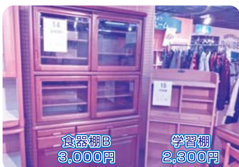
食器棚B 3,000円 学習棚 2,300円