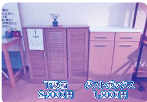
下駄箱 2,000円 ダストボックス 1,800円