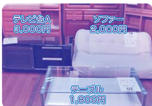
テレビ台A 3,000円 ソファー 2,000円 テーブル 1,800円