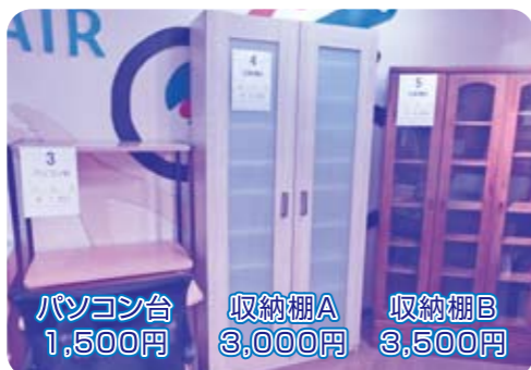
パソコン台 1,500円 収納棚A 3,000円 収納棚B 3,500円