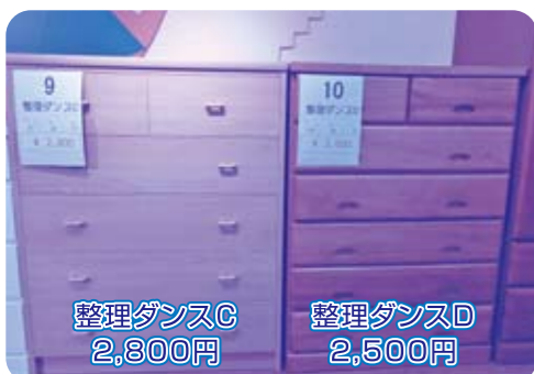
整理ダンスC 2,800円 整理ダンスD 2,500円

抽選日 3月6日(水)午後1時~ みどり園リサイクルプラザにて 応募締切日 3月5日(火)午後4時まで