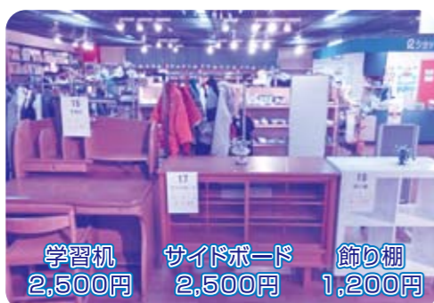
学習机 2,500円 サイドボード 2,500円 飾り棚 1,200円